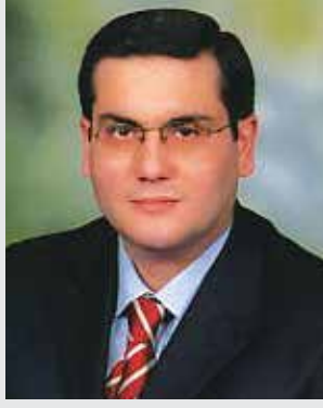
Av. Namık Kemal BAYAR