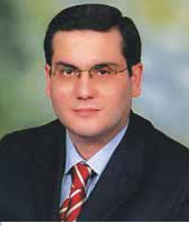
Namık Kemal BAYAR