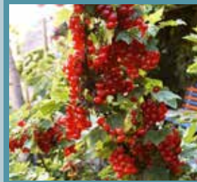
Qırmızı torğay yüzümi

Manav: Allah razı olsun! Daha da keliñiz!