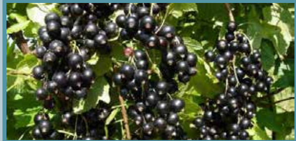
Qara torğay yüzümü