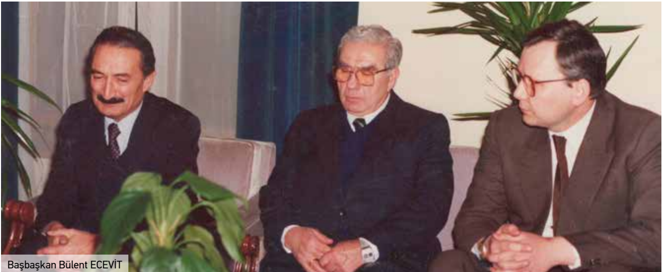
Başbaşkan Bülent ECEVİT