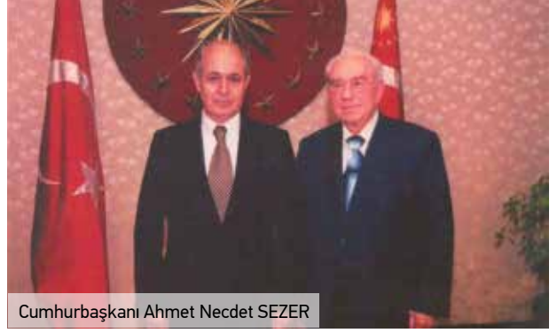
Cumhurbaşkanı Ahmet Necdet SEZER