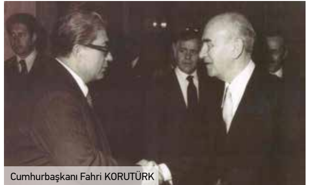
Cumhurbaşkanı Fahri KORUTÜRK