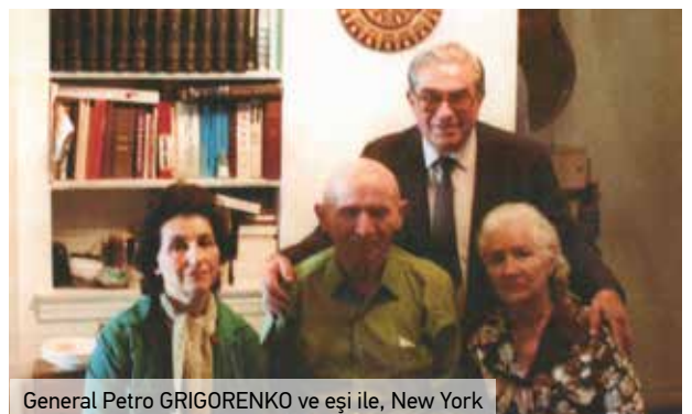
General Petro GRIGORENKO ve eşi ile, New York