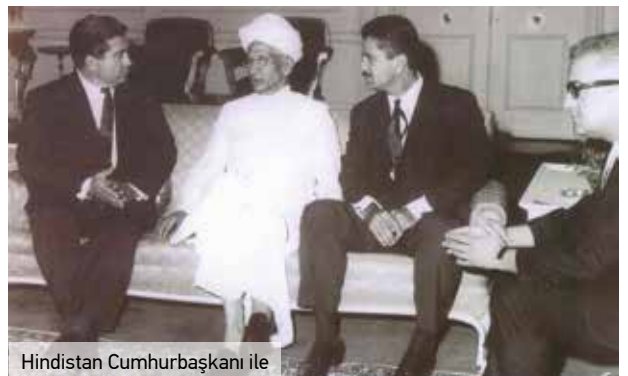
Hindistan Cumhurbaşkanı ile