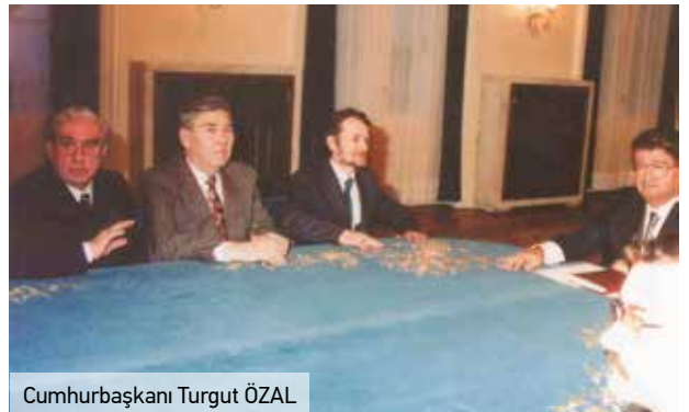
Cumhurbaşkanı Turgut ÖZAL