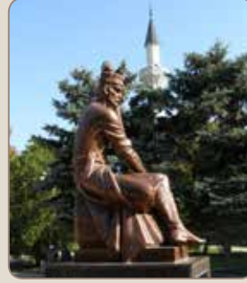
Aşiq Ömer Heykeli, Kezlev

2 Aybike – orta yolaq (Bağçasaray) şivesinen laf ete.