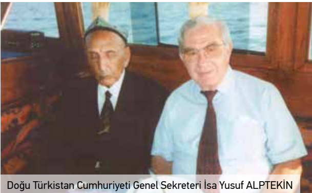
Doğu Türkistan Cumhuriyeti Genel Sekreteri İsa Yusuf ALPTEKİN