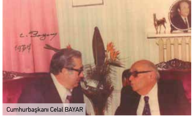
Cumhurbaşkanı Celal BAYAR