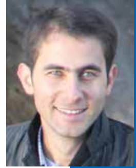
Ayder Acımambet Qırımtatar Yaşlıq Qurultaynıñ Qırım koordinatörü

Allah milletimizge ve Vatanımızğa hizmet etmekni nasib etsin.