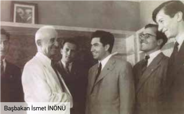
Başbakan İsmet İNÖNÜ