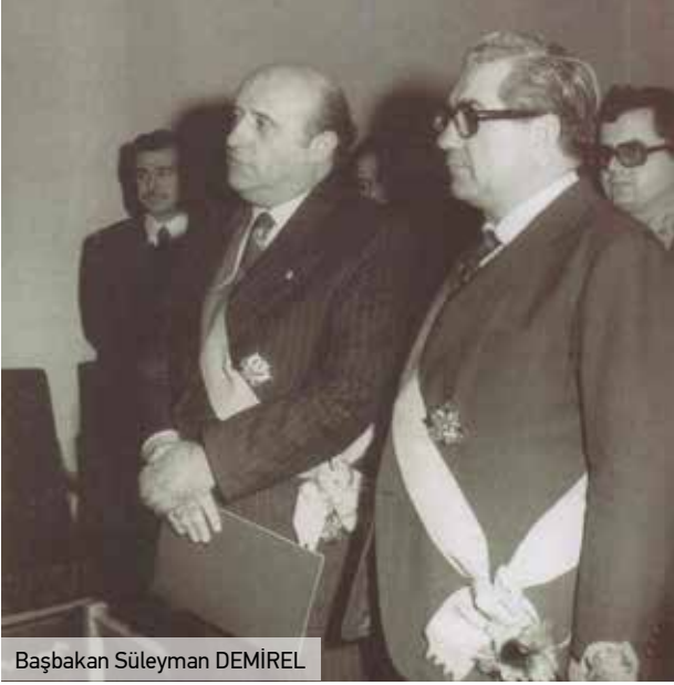
Başbakan Süleyman DEMİREL