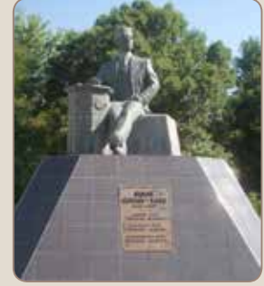
Bekir Çobanzade Heykeli, Qarasuvbazar