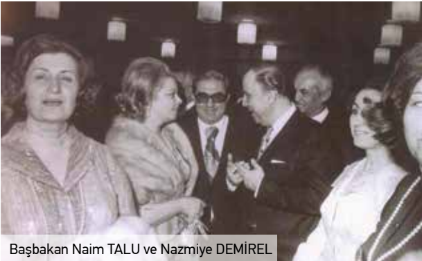
Başbakan Naim TALU ve Nazmiye DEMİREL