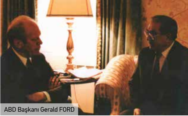
ABD Başkanı Gerald FORD